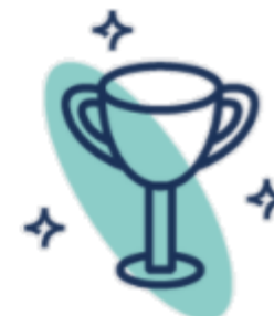
Gala Sukcesów na zakończenie roku