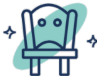
Dzień Dziecka w fotelu prezesa