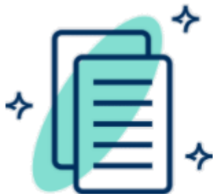
Profesjonalna i całkiem dorosła rekrutacja