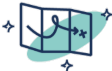
Odkrywcze wyprawy i przygody