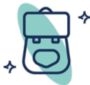
Wyprawka na rozpoczęcie edycji