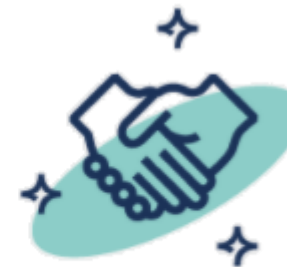
Wypracowanie partnerskiego kontraktu