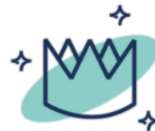
Spotkania z inspirującymi ludźmi