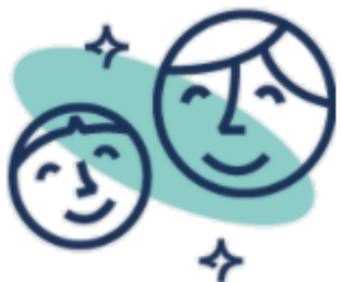
Cotygodniowe zajęcia z Tutorem